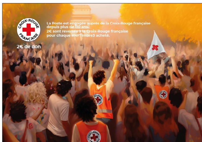
Verso du #NFTimbre3.